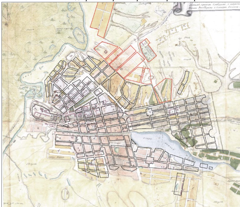
Рис. 1. План Казани 1817 г. ( http://lowkee.com/pictures/kazan1817.jpg ) с выделением планировочной структуры 1768 г. (выделена черным цветом) и вновь распланированных в 1838 г. территорий (выделены красным цветом) (иллюстрация авторов)

Большим вызовом для архитектора становится присоединение к городу и регулирование застройки овражных территорий, а также территорий у Арской дороги и в районе Суконной слободы (ул. Петербургская), так как из-за сложного рельефа, а также отсутствия или минимального надзора со стороны городских архитекторов.