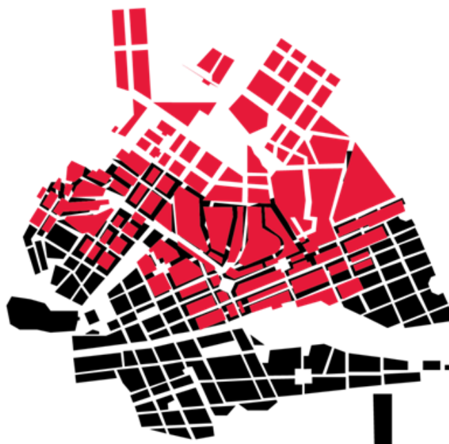
Рис. 2. Схема планировки Казани. Черным цветом выделены кварталы по плану 1768 года, красным цветом указаны кварталы по плану 1838 г.