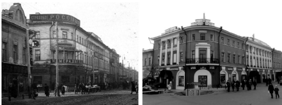
Рис. 1. Доходный дом Шарова на ул. Проломной (современная ул. Баумана): слева – фото нач. XX в. [12]; справа – фото 2018 г. (иллюстрация автора)

В конце XIX века происходят изменения, существенно меняющие внешний облик дома. Здание надстраивают третьим этажом, со стороны ул. Петропавловской (позднее Никольской, современная улица М. Джалиля) закладывают арочный проезд во двор. Вдоль правой границы участка появляется двухэтажный каменный жилой флигель, который соединяется с главным домом переходом, также со стороны двора к дому пристраивают небольшой 2-хэтажный прямоугольный в плане объём. Так дом приобрел современный вид (рис. 1).