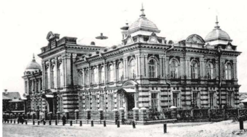
Рис. 4. Александровский образовательный дом (Алафузовский народный театр). 1900 г. Арх. Л.К. Хрщонович. Фото начало XX в.

В начале же XX в. в Алафузовском образовательном доме размещались фабрично-заводская школа с учебными аудиториями на двести учащихся, ясли для детей рабочих, клуб служащих, библиотека-читальня, зрительный зал на 900 мест со сценой для народного театра, физический кабинет и музей, библиотека, читальня, чайная и столовая, приют для рабочих и другие помещения [15].