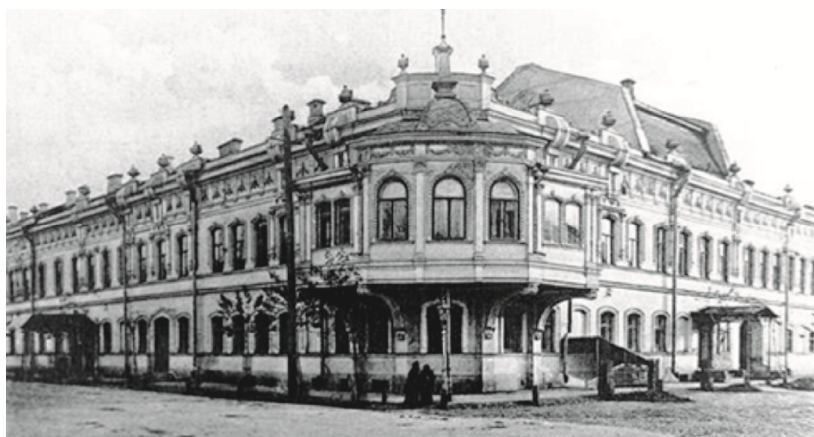
Рис. 3. Здание Купеческого собрания. Казань. 1903 г. Фото начала XX в.

С развитием промышленного капитализма формируется прослойка предпринимателей, промышленников, которые дополняют довольно многочисленный слой купечества. В городах формируются купеческие или коммерческие собрания. Происходит дифференциация зданий по классовому и сословному признакам, что стало стимулом развития новых типов зданий и разнохарактерности архитектуры, отражающей многообразие российской культуры того времени. Строятся сословные клубы (купеческие, мещанские), дома собраний и обществ. Также, как и в зданиях Дворянских собраний, непременным элементом таких зданий являлся большой зал для деловых собраний, балов, музыкальных вечеров и театральных представлений. В них формируется относительно типовый набор функций, которые могли выполняться одновременно или в разное время. Здесь налицо многофункциональный характер подобных зданий, как правило, представляющих целый комплекс. В них синтезированы функции культурно-развлекательная, общественно-деловая, коммуникативная, сервисная, жилая, общественного питания и другие.