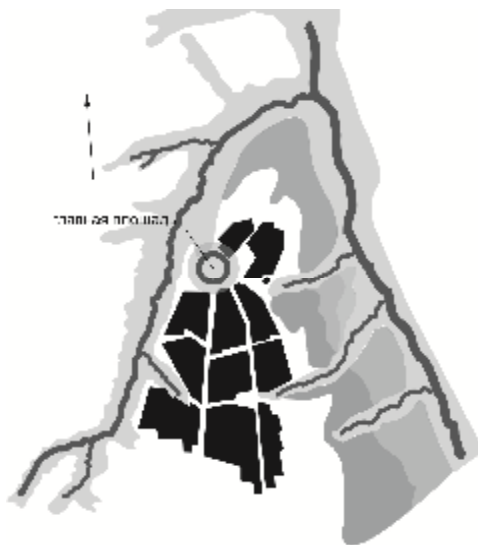
Рис. 2. Дорегулярная планировочная структура г. Тетюши конца XVII века

Застройка и заселение посадов происходили в результате местной инициативы, в то время как постройка самой крепости являлась делом государственной важности. В городах, построенных в XVI веке, еще было регулярной планировки жилых районов. Почти во всех городах уличная сеть развивалась по традиционной радиальной системе, испытывая тяготение, с одной стороны к укрепленному центру, с другой – к дорогам в окрестностях и соседних селениях (г. Елабуга) [4]. В некоторых случаях заметна тенденция к образованию кольцевых направлений коммуникаций (г. Тетюши) (рис. 2) [5].