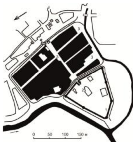
Рис. 3. Дорегулярная планировочная структура г. Цивильска конца XVII века. Условные обозначения: 1 – крепостные стены, 2 – крепость, 3 – посад

Анализируя геометрическую карту Казанской губернии (1793-1796 гг.), разделенную на 12 уездов и уездных городов, можно заметить во многих из них наличие «правильного» начертания кварталов, стремление их к равномерной ширине и другие признаки регулярной планировки (г. Цивильск) (рис. 3) [6]. Встречающиеся неправильности (изломы, тупики) являлись здесь результатом постепенного нерегулируемого роста города, во многих случаях приспособления к сложным топографическим условиям [2, с. 59].