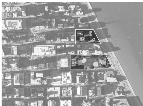
Лейк Шор Драйв в Чикаго