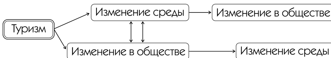
Рис. 1. Влияние туризма на преобразования в пространственной среде

наблюдается изменение в обществе – идет переориентация рабочей силы в профессии, связанные с туристической деятельностью. Это, в свою очередь, влечет потребность в квалифицированных кадрах (гиды, переводчики, экскурсоводы) и необходимость создания учреждений по подготовке таких специалистов. Создание подобных образовательных организаций влечет за собой изменение среды. Появляются университеты, центры обслуживания, происходит преобразование территорий и структуры поселений в целом.