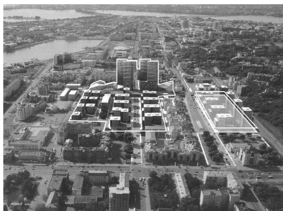
Вид на квартал Б по ул. Островского в г. Казани