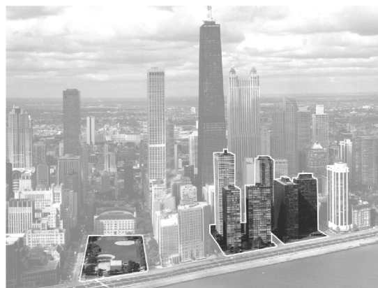
Вид на Лейк Шор Драйв в Чикаго