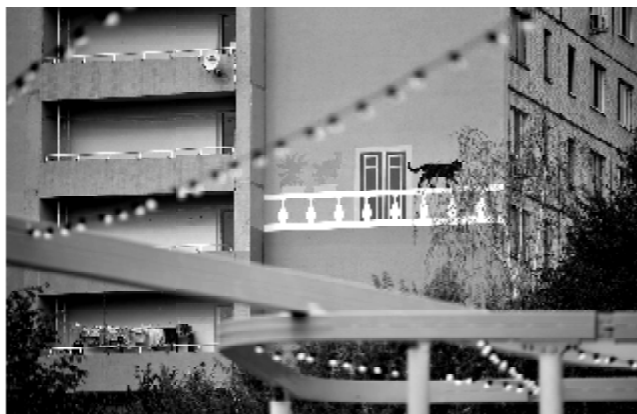
Рис. 3. Стрит-арт. Бульвар в спальном районе г. Казань, ул. Фучика ( http://park.tatar/kazan_fuchica )

Кроме того, для воссоздания утраченного облика и атмосферы актуальны такие приемы как использование исторической символики, использование элементов малых архитектурных форм (мощение, фонари, решетки, скульптуры и др.). Все чаще становятся популярными различные версии стрит-арта. Стрит-арт стал индустрией «образного наполнения застройки» [3] и имеет свою функцию в процессе реорганизации общественных пространств [13] (рис. 3).