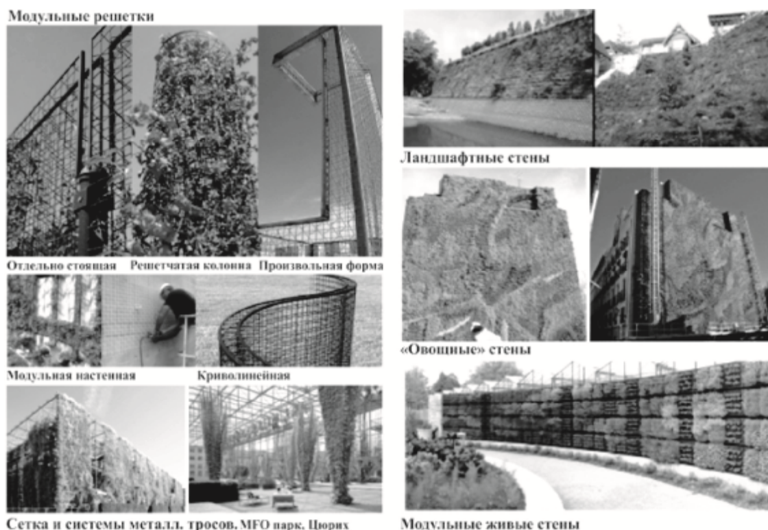
Рис. 2. Типология зеленых стен. Живые и зеленые стены

Модульные живые стены. Модульная система живой стены возникла частично из использования модулей для применения зеленых крыш, с целым рядом технологических новшеств. Модульные системы состоят из квадратных или прямоугольных панелей, которые поддерживают питательную среду для содержания растительного материала.