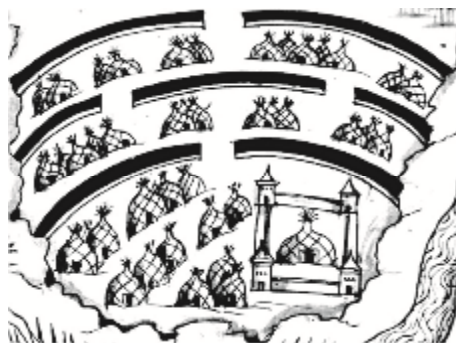
Рис. 4. Крепость Кызыл-Тура, изображенная на Ремезовской летописи

На северной оконечности мыса располагалась сторожевая башня. Она стояла на деревянном свайном фундаменте [15, с. 96]. По мнению Халикова А.Х. на месте нынешней башни Сююмбике XVII века в XIII-XIV веках располагалась белокаменная сторожевая башня, которая также имела проезд на нижнем ярусе [15, с. 137]. Она была высотой около 25-30 м, имела сквозной проезд 3,5 м и два пилона (3,5x4,3 м) на первом ярусе. Фундамент (глубина заложения – 1,3 м) башни был обнаружен в 1977 году, который был установлен на уплотненном сваями-коротышами основании. По выводам археолога перекрытия башни были деревянными и ее изображение можно увидеть на карте Фра-Мауро 1459 года [7, с. 19].