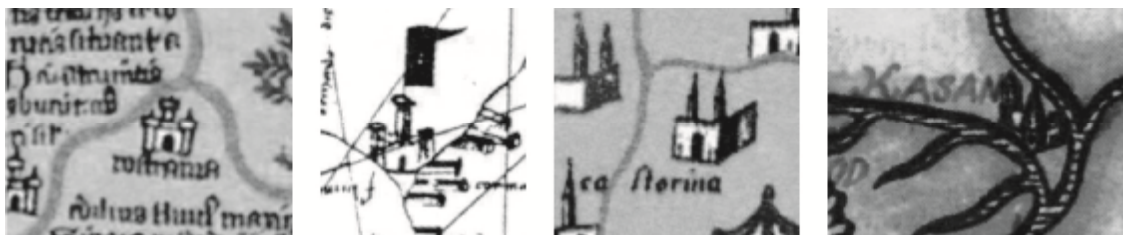
Рис. 1. Изображение Казани на некоторых географических картах XIV-XVI вв.

После разорительных походов монгольской армии на Волжскую Булгарию происходит миграция коренного населения в северные районы государства. Город Казань благодаря выгодному местонахождению становится одним из центров политической и культурной жизни государства. В это время она обозначена на многих географических картах и изображена в виде караван сарая (рис. 1). Несмотря на то, что монголы разрушили около 40 укрепленных пунктов [15, с. 121] и ввели запрет на укрепление большинства крепостей подвластных территорий [15, с. 128], это не коснулось Казани, которая в период Золотой Орды не теряет своих стратегических функций таможенного пункта на реке Идель.