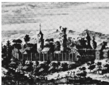
Рис. 5. Фрагмент гравюры Касимова, опубликованной А. Олеарием, с изображением арка Касимова

Исходя из вышеизложенного, можно сказать, что Казанская крепость в XIII-XV вв. развивалась как фортификационное сооружение. Город имел несколько ступеней обороны с дополнительными рвами, валами и стенами. Крепость была реконструирована