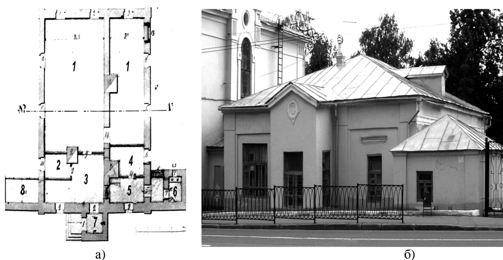
Рис. 3. Николаевское (Двадцать первое) городское мужское училище а) План двадцать первого городского училища на Николаевской площади. Кон. XIX – нач. XX вв. 1. Учебный класс. 2. Учительская. 3. Гардеробная. 4. Комната сторожа. 5. Коридор. 6. Туалет. 7. Тамбур. 8. Службы. 9. Дворовая территория со спортивной площадкой. б) Здание бывшего двадцать первого городского училища на ул. Пушкина (бывш. Николаевская площадь). Современный вид

Обследование, сделанное властями в 1888 г., показало, что большая часть городских училищ размещалась в зданиях, в целом отвечавших санитарно-гигиеническим требованиям [7, с. 66]. Возможно, этот факт являлся следствием перемещения по решению Думы некоторых училищ из наемных помещений в городские здания, более отвечавшие требованиям учебного процесса.