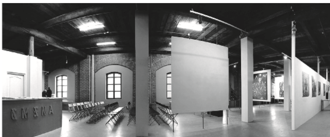
Рис. 2. Центр современной культуры «Смена» [7]

Проектируются по принципу универсальности и многообразном использовании внутреннего пространства, путем создания единого укрупненного внутреннего пространства с предпочтительно простым очертанием объема. Количество посадочных мест может меняться в зависимости от масштаба мероприятия, свободная планировка позволяет занимать помещение лектория в различных направлениях и менять месторасположение экрана и выступающего. Мобильность данного пространства позволяет использовать его практично и многофункционально, к примеру, пространство лектория легко переоборудуется под выставку. Лекторий и выставочное пространство могут разграничиваться занимаемыми площадями или временным режимом работы. Примером подобного лектория может послужить Центр современного искусства «Смена» г. Казань, открывшийся в 2013 году, который изначально в распоряжении имел лишь мансардный этаж с несколькими комнатами и один большой зал свободной планировки. Изначально зал перемененно являлся лекторием и выставочным пространством, позже был разграничен с помощью визуальных приемов на зону книжного магазина, лекторий и выставочную зону (рис. 2).