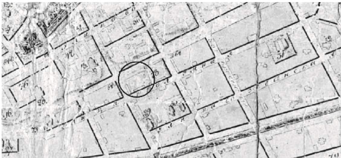
Рис. 1. Фрагмент генерального плана г. Казани 1768 [2]

Торговые ряды являлись частью комплекса «хлебного базара», который был построен по проекту архитектора В.И. Кафтырева в 1796 году и согласно [2] является памятником архитектуры XVIII века. Впервые место «торговых рядов» зафиксировано на плане города в 1768 года как «житной торг». В соответствии с генпланом на месте старого «Житного торга» В.И. Кафтырев запроектировал новую «хлебную площадь» [2], которая располагалась в пределах квартала ограниченного улицами Баумана, Профсоюзная, М. Джалиля, К. Наджми (рис. 1). Торговые ряды представляли собой двухэтажное здание, которое являлось самым крупным на «хлебной площади». По коротким сторонам площадь фланкировали два павильона.