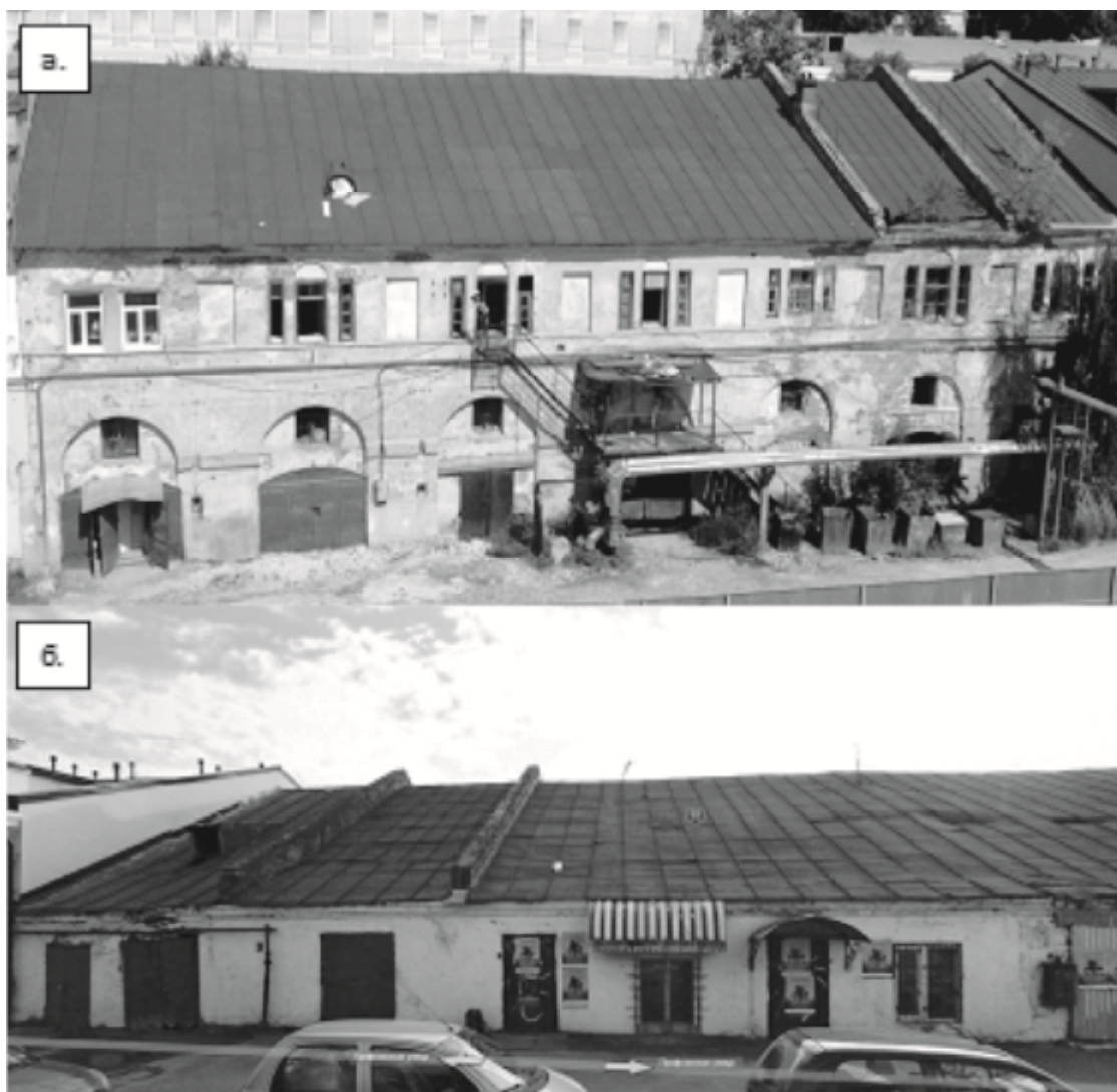
Рис. 2. Общий вид здания: а. Фасад со стороны ул. Баумана [1]; б. Фасад по ул. Профсоюзная

Здание торговых рядов прямоугольное в плане имеющее развитую подземную часть, «врублено» в «Казанский хребтик» между ул. Профсоюзная (бывшая ул. Малая Проломная) и ул. Баумана (бывшая ул. Большая Проломная), расположено в исторической части города Казань. Архитектурный ансамбль хлебной площади занимал весь квартал, и выстроен на месте старых деревянных хлебных амбаров и казенного кабака, которые были уничтожены частыми в центральной части города пожарами. Архитектор выполнил его как длинный ряд торгово-складских помещений, объединенных галереями. Галерея открывалась на торговую площадь аркадой торговых павильонов (рис. 2а). Со стороны ул. Профсоюзной здание имеет один надземный и один подземный этаж, его фасад, представленный на рис. 2б, кирпичный оштукатуренный, отличается полным отсутствием декора и завершается ступенчатым карнизом.