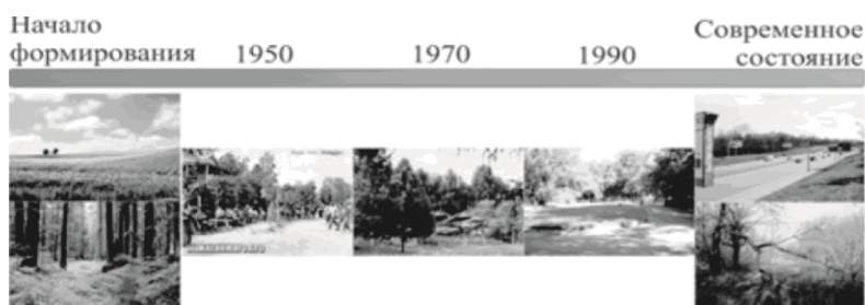
Рис. 2. Модель советского парка на основе данных составленного хроноряда

По данным хроноряда сформирована абстрактная модель, отражающая развитие и современное состояние советского парка в г. Казани (рис. 2).