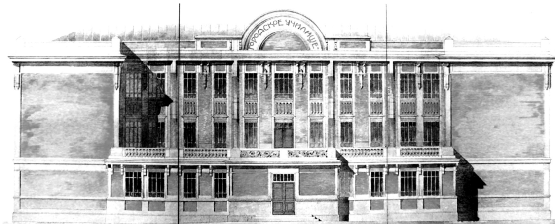
Рис. 1. Проект Петровского женского училища на ул. 2-ая Гора. 1912 г. Главный фасад. Первый вариант. Арх. М.С. Григорьев [2]

террасой (рис. 1). В боковом корпусе, предназначавшемся под квартиры учителей и учеников, он сократил их количество, оставив по две квартиры на этаже в торце корпуса, а на освободившихся площадях разместил учебные классы. Второй вариант проекта Петровского училища оказался более экономичным (рис. 2).