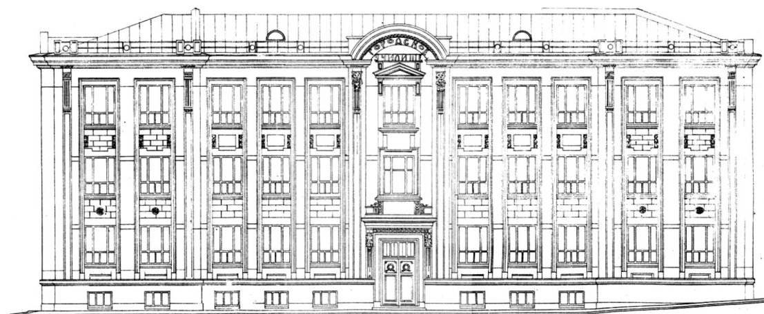
Рис. 2. Проект Петровского женского училища на ул. 2-ая Гора. 1912 г. Главный фасад. Второй утвержденный вариант. Арх. М.С. Григорьев [3]

В результате внесенных корректировок изменился и внешний облик здания [3]. Вместо глухих боковых плоскостей на главном фасаде появились равномерно расположенные большие прямоугольные окна, придавшие зданию выраженный общественный характер. Симметричное построение фасада подчеркивалось боковыми ризалитами и центром, фланкированными по сторонам пилястрами на всю высоту здания. Центральная часть, отмеченная входом и треугольным фронтоном над верхним окном, завершалась полукруглым фронтоном.