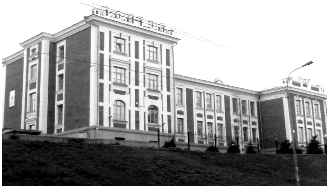
Рис. 3. Здание начального училища на ул. Новогоршечной. Построено в 1913 г. Арх. М.С. Григорьев. Современный вид

Двухэтажное с трехэтажной частью училище на Новогоршечной улице имело П-образный план с поперечными выступами различной длины, придававшими зданию асимметричность. Поставленное на горе, на спуске Новогоршечной улицы, оно возвышалось над нижней частью города (рис. 3).