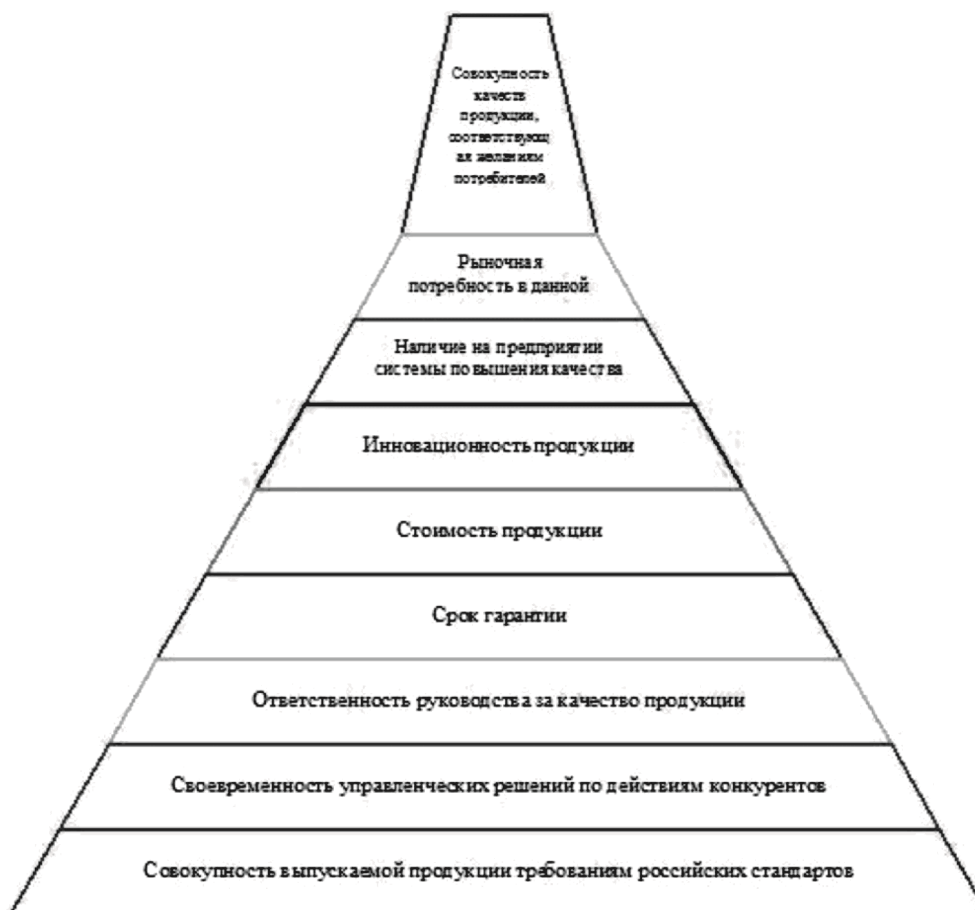
Рис. 4. Пирамида конкурентных преимуществ строительной продукции

Зависимость конкурентоспособности от различных факторов представлена на рис. 4.