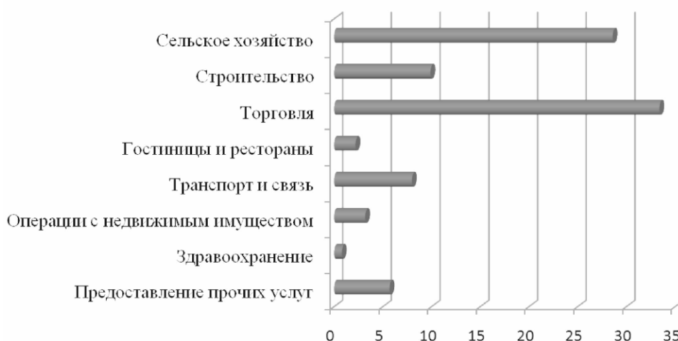
Рис. 2. Диаграмма занятости населения России в неформальном секторе на 2012 г.

Обращаясь к истокам проблемы городских рынков, мы видим, что ответ на вопрос об организации торговли часто рассматривался учеными средневековья в 11-14 столетиях, когда города только начинали формироваться. Большинство текстов и картин воспроизводят город как тесно застроенный центр, окруженный стенами и с доминантами культовых сооружений в панорамном виде. Рынок, где имела место торговля различными товарами, был центром трудоустройства города и его позиция была укреплена культурными и политически-административными функциями. Джованни Ботеро (итальянский мыслитель средневековья) утверждал, что простота доставки провизии была одним из основных факторов размера города. Он отметил, что товары транспортировались по воде или суше, и что пересечение сухопутных и водных путей является реальным исходным условием для роста городского поселения. Он также упомянул, что в большинстве случаев государственные, законодательные, религиозные или ритуальные функции укрепляют этот физический рыночный центр. Вопрос расположения рынков, конечно, также вызвал интерес многих ученых, изучающих историю развития городов [9].