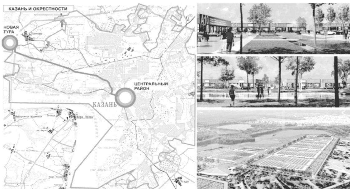
Расстояние от Казани до Новой Туры составляет 23 км.

его первый торговый павильон сдали в эксплуатацию 15 сентября 2012, а с 1 октября 2012 года в Казани стали закрываться вещевые рынки, начиная с рынка Витариус по ул. Журналистов («вьетнамский рынок»), который первым переехал в новый павильон. На границе Казани и Зеленодольского муниципального района будет построен уникальный торговый комплекс, отвечающий современным архитектурным, градостроительным, экономическим и санитарным требованиям. На территории площадью 200 га будет размещено большинство работавших в Казани вещевых рынков. На освободившихся в городе территориях предполагается разбить скверы. С одной стороны, переезд вещевых рынков в Новую Туру позволит перевести рыночную торговлю в цивилизованное русло, обеспечить комфортные условия для продавцов и покупателей, решить проблему пробок, возникающих возле казанских рынков [11, 12, 13]. Однако переезд имеет множество важных последствий, например, обеспечение жильем сотрудников рынка, транспортная доступность для покупателей и продавцов, ценовая доступность товаров в новых условиях. Революционный путь преобразования исторически сложившихся мест торговли Казани, таких как Центральный, Московский рынки, после приведения реформы в действие может повлиять на утрату рыночной культуры города и жизнь важнейших торговых артерий.