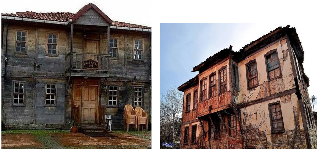
Рис. 2. Традиционные исторические дома Самсуна

Также следует отметить, что хотя дерево было основным материалом для исторических жилых домов, их корпусные и цокольные части, безусловно, были выполнены из камня (например, из идольского щебня) (рис.2).