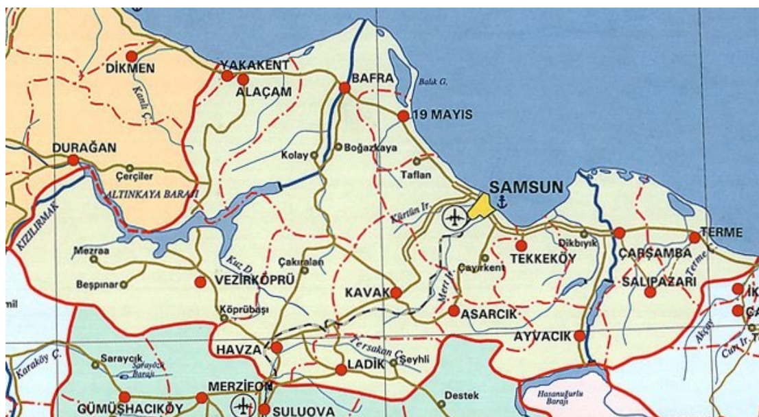
Рис.1. Карта города Самсун

Следует отметить, что исторически в жилом строительстве было много общего, но отличия в социальном статусе населения намечали первые типы жилых домов и отличали их друг от друга. То есть, помимо обычных домов деревенского типа, также существовали жилые дома полугородского типа и усадебно-дворцового типа. Это основывалось на формах сословного разделения, возникшего в городах и деревнях Турции (рис.1). Например, в городах появились дома с двумя рядами комнат, что было более характерно для XVIII и XIX веков. Таким образом, предпосылки для появления и развития исторических жилых домов в городе Самсун включают древнюю историю, роль города как порта и торгового центра, природные условия, социальное разделение, влияние торгово-прикладных промыслов и современный туристический потенциал.