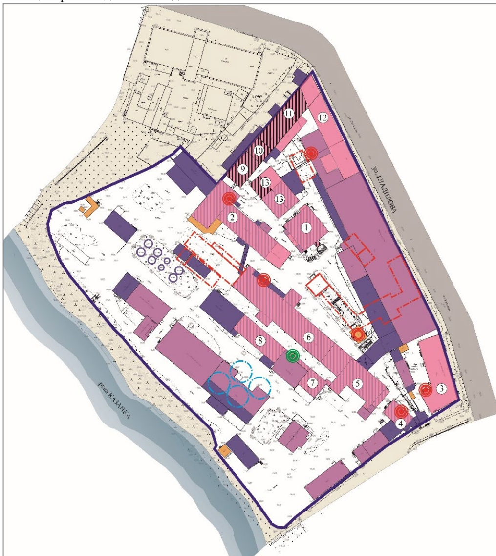
Рис.5. Историко-архитектурный опорный план Главного комплекса Алафузовских фабрик Fig.5. Historical and architectural reference plan of the Main complex of Alafuzov factories

комплексы, и малоэтажной жилой застройкой эти два здания олицетворяли культовый и культурный центры Ягодной слободы.