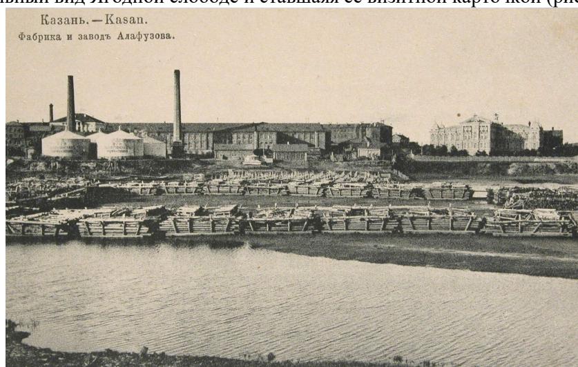
Рис.7. Панорама Ягодной слободы с противоположного берега реки Казанка. 14 Fig.7. Panorama of Yagodnaya Sloboda from the opposite bank of the Kazanka river

В отличие от первоначального вида с реки, к началу XX в. со строительством энерго-технических зданий (газовой станции, электростанции, нефтехранилищ) с дымоходными трубами формируется речная панорама главного комплекса, придававшая индустриальный вид Ягодной слободе и ставшая её визитной карточкой (рис. 7).