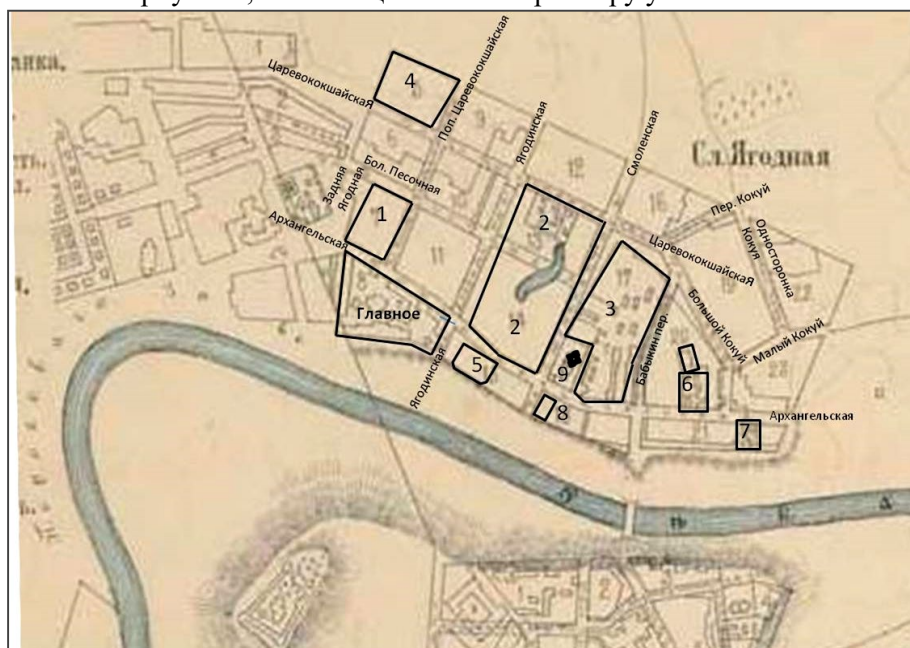
Рис. 6. Алафузовский промышленно-пространственный комплекс в Ягодной слободе Казани в начале XX в.: схема размещения всех отделений Алафузовского комплекса в планировочной структуре Ягодной слободы (Схема авторов: 1-8 – отделения, 5 -Алафузовский театр, 9 – Смоленско-Дмитриевская церковь)

Композиционная структура комплекса от свободно-упорядоченной с одно-двухэтажными зданиями видоизменяется на связно-периметральную с трехэтажными краснокирпичными корпусами, смыкающимися по периметру участка.