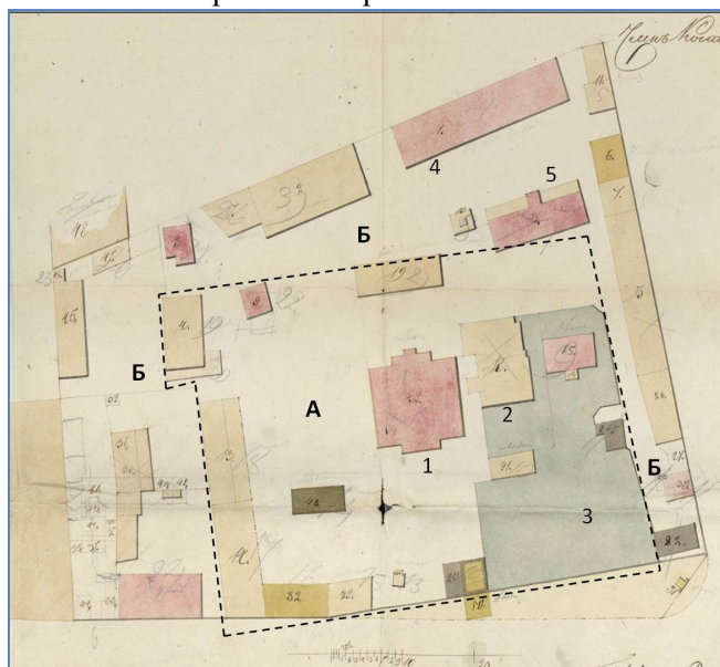
Рис. 2. «План месту, состоящему в 5 части в Ягодной слободе ... купца Котелова» 2

Особенность данного комплекса заключалась в том, что хозяйская жилая часть усадьбы занимала территорию, указанную на рис. 2 пунктирными линиями. В её центре находился построенный ранее одноэтажный каменный дом владельцев усадьбы Котеловых, к северу от которого располагался старый деревянный хозяйский дом и был разбит большой сад. По периметру хозяйской части усадьбы располагались жилые флигели, конюшни, сараи и другие хозпостройки. С трех сторон вокруг этой хозяйской жилой части сформировалась производственная зона с преимущественно деревянными постройками для переработки кож (основное заводское здание, красильня, сушильня, кузница и т.д.). По проекту П.Г. Пятницкого предполагалось надстроить каменный дом деревянным вторым этажом и мезонином, заменить обветшавшие деревянные производственные и хозяйственные постройки новыми, некоторые из которых должны были быть кирпичными. На ул. Архангельскую со двора вели ворота, располагавшиеся напротив нового дома Котеловых. Помимо этих парадных ворот на территорию комплекса вели хозяйственные ворота с севера и юга.