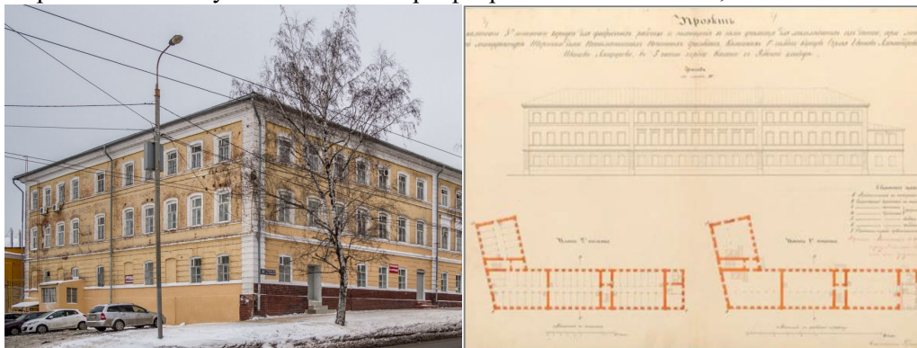
Рис. 3. Общий вид корпуса и проект на постройку каменного трехэтажного корпуса для фабричных рабочих и помещения в нем училища для их малолетних детей при льно-прядильной механической ткацкой мануфактуре С. Е. Александрова и И. И. Алафузова 9

В 1876 году Алафузов выстроил для рабочих лечебницу - двухэтажное здание на углу ул. Архангельская и ул.Смоленская. При фабрике имелись школа, аптека и столовая.