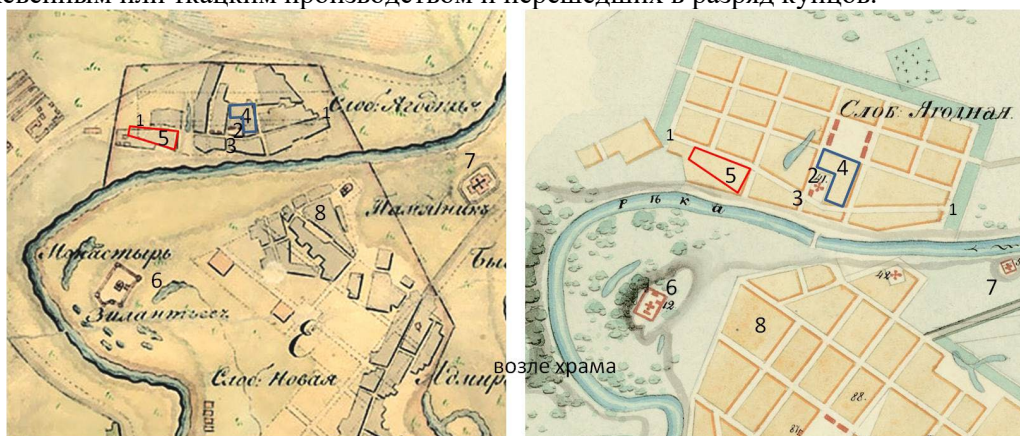
Рис. 1. Планы Ягодной слободы 1-й половины XIX в.: слева – нерегулярный план Ягодной слободы 1-й трети XIX в. (План губернского города Казани с окрестностями, 1850 г.); справа – регулярный план Ягодной слободы (План города Казани, подтвержденный в 1842, 1845, 1848):

На регулярном плане слободы видно, что улица Архангельская сохранила свое ломаное начертание. Очевидно, это было связано с затруднительным перемещением Смоленско-Дмитриевской церкви и кирпичных строений заводов в этой части слободы. И все оставили, как было. Композиционным центром Ягодной слободы на протяжении XIX в. служила Смоленско-Дмитриевская церковь в стиле барокко, располагавшаяся на небольшой площади по правой стороне Архангельской улицы. В 1806 г. вблизи церкви было построено одноэтажное кирпичное здание начального училища для слободских детей. Застройка слободы формировалась в основном небольшими усадьбами с одноэтажными деревянными домами в традициях народной архитектуры. Однако с начала XIX века и ранее в объемно-планировочной структуре с.Ягодного выделялись крупные участки домовладений разбогатевших экономических крестьян, занимавшихся кожевенным или ткацким производством и перешедших в разряд купцов.