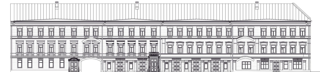
Рис. 4. Фасад главного дома Апанаевского подворья по ул.Московской на нач. XXв. (иллюстрация автора)

В 1900-1903 гг. происходит реконструкция, поменявшая облик домовладения. На месте двухэтажного усадебного дома с одноэтажными лавками строится новое трехэтажное здание прямоугольное в плане, при этом старые строения входят в его состав (архитектор неизвестен). Они надстраиваются вторым и третьим этажами и объединяются в один объем (рис.4). В начале XX века участок превратился в большой доходный комплекс с пятью жилыми корпусами, хорошо известный как Апанаевское подворье, а с 1910 г., как «Московские номера».