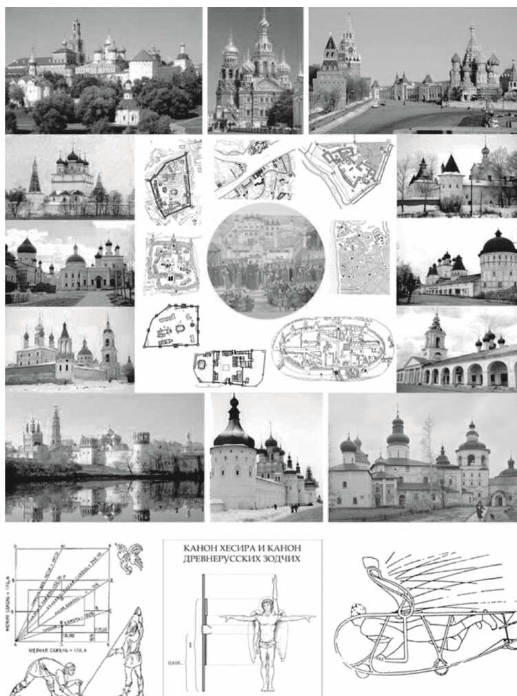
Рис. 1. Ансамбли зодчества центральной исторической части России: образные иконографические алгоритмы, схематические градпланы и антропотектонические модулы, полезные для понимания синархиотектоники предназначения пространства, где синархиотектоника предстает в единстве син («целое»), архи («высшее»), тектоника (конструктивная организация пространства в материале)

Жизнеустроение совершается на основе пространственных начал, воспроизводящих саму реальность в качестве самого важного в том числе и для зодчества: любви во взаимоотношениях мужчины и женщины, с тайной новорожденной жизни, завещанной нам любви к ближним. Если согласиться с тем, что гендер (англ. gender , от лат. gender «пол») – это социальный пол, определяющий поведение человека в обществе и то, как это поведение воспринимается, то надо согласиться и с тем, что это все зазеркально воспроизводится и в окружающей человека предметно-пространственной среде. Полороловое поведение, которое определяет опосредованные средой отношения с другими людьми, (друзьями, коллегами, одноклассниками, родителями, случайными прохожими и т.д.), во фрактально-аналоговой форме реализуется в архитектуре, дизайне, градостроительстве – в зодчестве. Из всемирной истории архитектуры известен один показательный пример любодееяния пространства выдающегося архитектора Антонио Гауди в отношении к прекраснейшему по совершенству знаменитому собору Саграда Фамилия в Барселоне (Церковь Святого Семейства). Это гениальное сооружение он, не будучи женатым, проектировал и до конца жизни руководил строительством с доминирующим и всепоглощающим обращением своей любви к Богу. Храм создавался, долгие годы и его строительство не закончено, осуществляется поныне, продолжая покорять взоры и сердца людей [2].