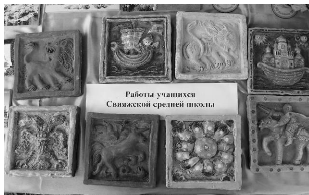
Рис. 4. Керамические изразцы, выполненные учащимися Свяжской средней школы.

Выбор видов ремесел для мастерских необходимо осуществлять на основе исторического обоснования; наличия мастеров, владеющих традиционными ремесленными техниками, и с учетом востребованности ремесел со стороны туристов и местных жителей;