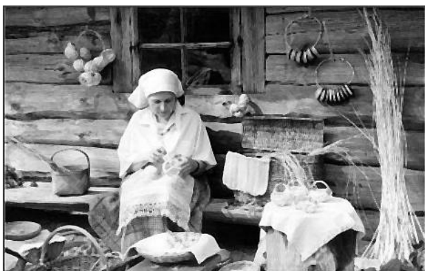
Рис. 3. Латвийский этнографический музей под открытым небом в Риге [7]