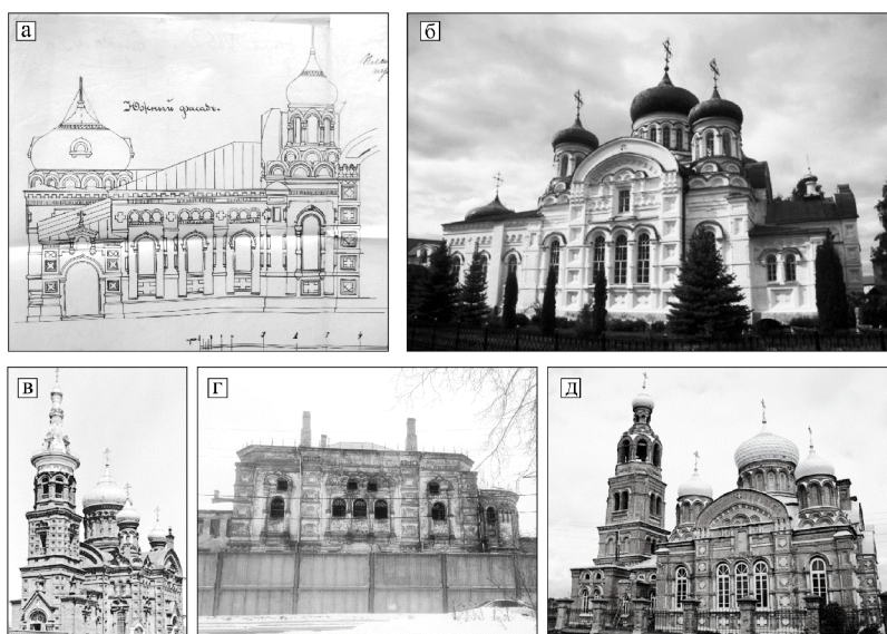
Рис. 1. Типовой проект пятикупольного храма в разных интерпретациях, арх. Ф.Н. Малиновского. а) Троицкая церковь в Раифском монастыре б) проект пристройки к Троицкой церкви [3, д. 141]; б) церковь Трёх Святителей Казанских в г. Казани – утрачена в 1833 г. (фотография А.И. Бренинга); в) Макарьевская церковь в г. Казани (сегодня исправительно-трудовая колония № 2) (авторская фотография); г) церковь в селе Смолдеярово (авторская фотография)

Серьёзным реконструкциям в русско-византийском стиле подверглись ещё два казанских храма – Варваринская церковь на Арском поле и собор Успения Пресвятой Богородицы в Успенском Зилантовом монастыре [3, д. 73]. Множество подобных виртуозных перевоплощений церквей из одного стиля в другой, как сказали бы архитекторы-реставраторы «смена одежды фасадов», происходили по всей территории обширной Казанской епархии. Работы были связаны не всегда с кардинальным изменением внешнего вида храма, иногда пристройки кардинально отличались от существующих старинных объёмов зданий, как например пристройка паперти к Успенской церкви в Чебоксарах [3, д. 540]. Бывало искусный мастер, наоборот, дополнял существующий архитектурный образ своими вмешательствами, так, к храму в Успенском женском монастыре Малиновский пристроил два симметричных придела по обе стороны