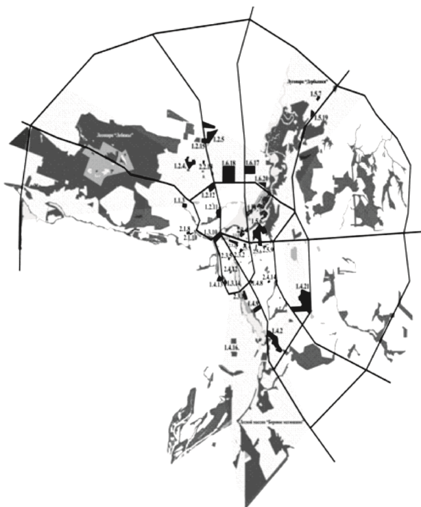
Рис. Диаметально-клиновидная система озеленения г. Казани. Проект 1974 г. «Москоммунстрой»? (Реконструкция автора)

В связи с нереализованным строительством парка-стадиона им. Ленина, парка Комсомольский, парка Молодоженов, парка детского отдыха Соцгорода, ПКиО завода, ПКиО и парка детского отдыха Восточного заречья, ПКиО Приволжского района, парка детского отдыха Советского района трудно объективно судить об элементах оригинальности этих объектов СПС (рис.).