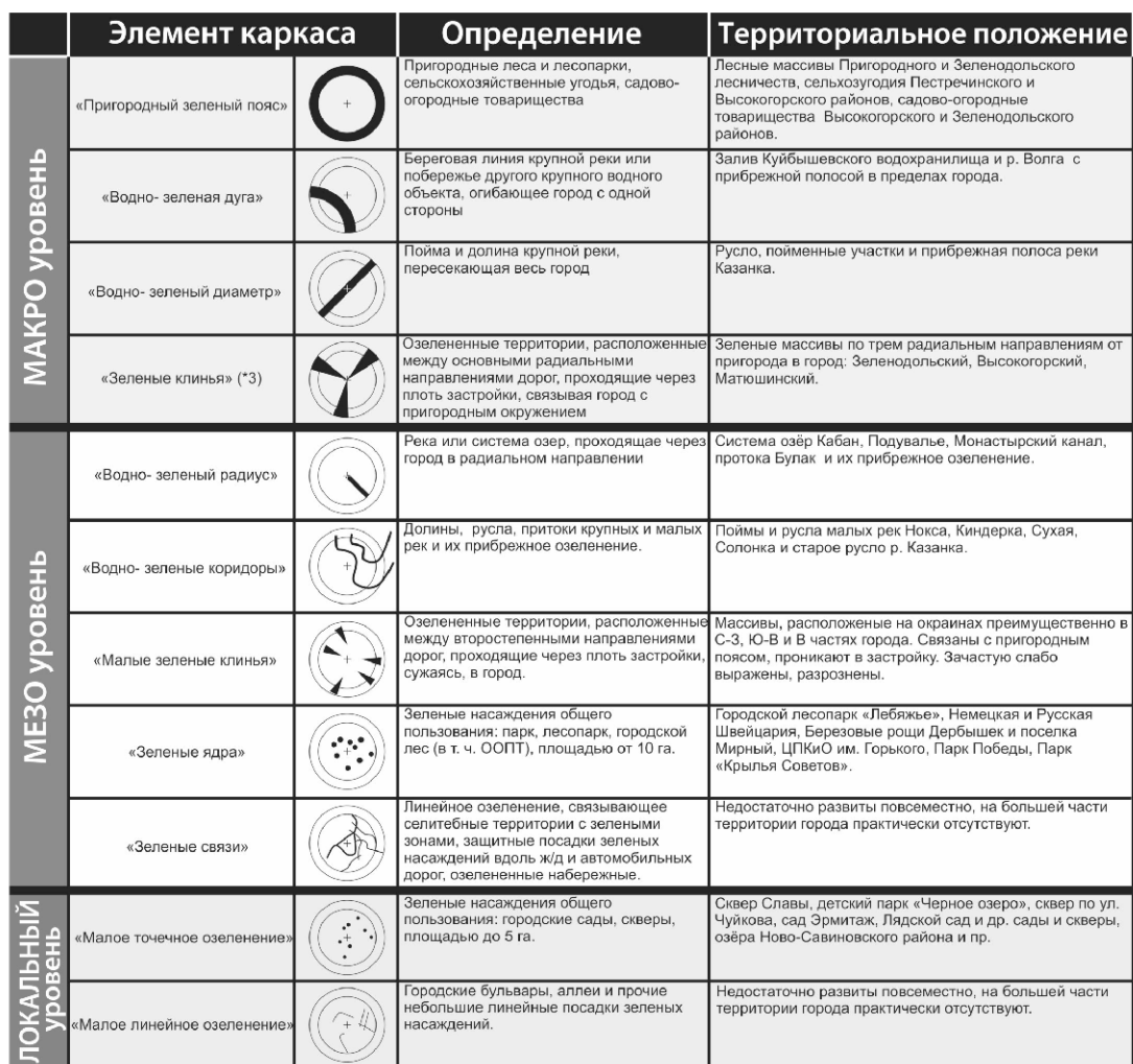
Структурная иерархия элементов ПК